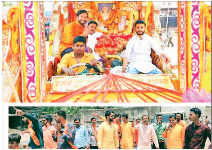
हरिभूमि न्यूज ►► भाटापारा

हनुमान जयंती पर निकाली शोभायात्रा, सैकड़ों लोग हुवे शामिल, लोगों ने लगाए जय हनुमान के जयकारे