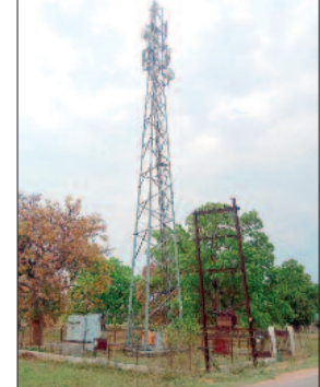
हरिभूमि न्यूज ►► नरर

परसुली मुख्य मार्ग पर स्थित जियो टावर में कई महीनों से नेटवर्क कमजोर या रेंज के अभाव से उपभोक्ता परेशान है। इस गांव तथा आसपास गांवों के जियो उपभोक्ताओं ने बताया कि गांव में बिलकुल नेटवर्क नहीं बताता। टावर के पास आने से नेटवर्क मिल पाता है। जिससे नेट की समस्या से च्वाइस सेंटर्स को भी परेशानी का सामना करना पड़ रहा है। समय पर नक्शा खसरा बी वन एवं फिंगर से पैसा निकासी नहीं हो पा रहा जिसके चलते जियो ग्राहकों में आक्रोश व्याप्त है। पीड़ितों ने टावर की रेंज क्षमता वृद्धि को शीघ्र बढ़ाने की मांग की है।