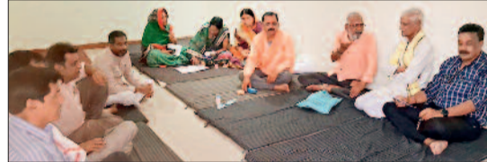
बैठक में विभिन्न बिन्दुओं पर होगी चर्चा

हरिभूमि न्यूज ►► भाटापारा सरयू साहित्य परिषद द्वारा समय-समय पर विभिन्न आयोजनों के माध्यम से निरंतर रचनात्मकता का संदेश प्रसारित किया जा रहा है। इसी कड़ी में सबसे राम सबसे राम की अवधारणा के साथ विगत पांच वर्षों से रामायण ज्ञान परीक्षा प्रतियोगिता के माध्यम से भगवान राम के जीवन वृत्त तथा रामायण की महत्ता प्रसारित करने का कार्य निरंतर जारी है। प्रतिवर्ष तुलसी जयंती पर होने वाले इस आयोजन में अभी तक सरयूपारी ब्राह्मण समाज की भागीदारी रहती थी, लेकिन परिषद द्वारा महसूस किया गया कि सबसे राम सबसे राम की अवधारणा को पूरी तरह फलीभूत करने के तहत भागीदारी में विस्तार की आवश्यकता है। इस मसले पर विभिन्न ब्राह्मण समाज प्रकल्प प्रमुखों से चर्चा पर इस विषय पर चंडुओर से सकारात्मक संदेश प्राप्त होता हुआ नजर आया एवं समस्तजनों द्वारा एक स्वर में इस पहल की सराहना करते हुए समर्थन किया गया।