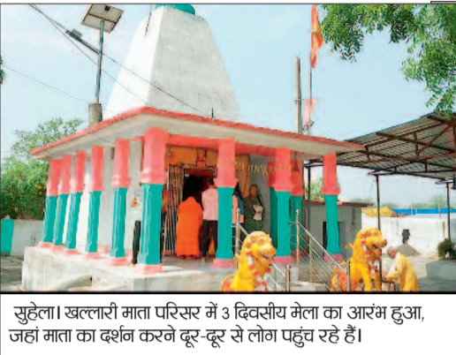
सुहेला। खल्लारी माता परिसर में 3 दिवसीय मेला का आरंभ हुआ, जहाँ माता का दर्शन करने दूर-दूर से लोग पहुंच रहे हैं।